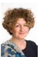
Projekt okładki Dorota Matkowska