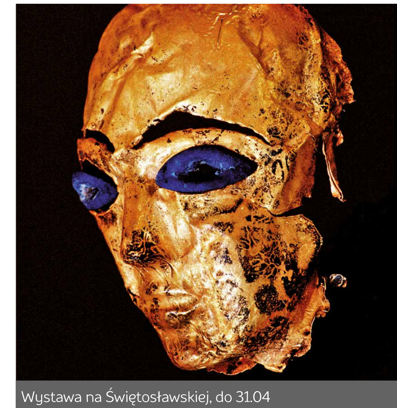
Wystawa na Świętosławskiej, do 31.04