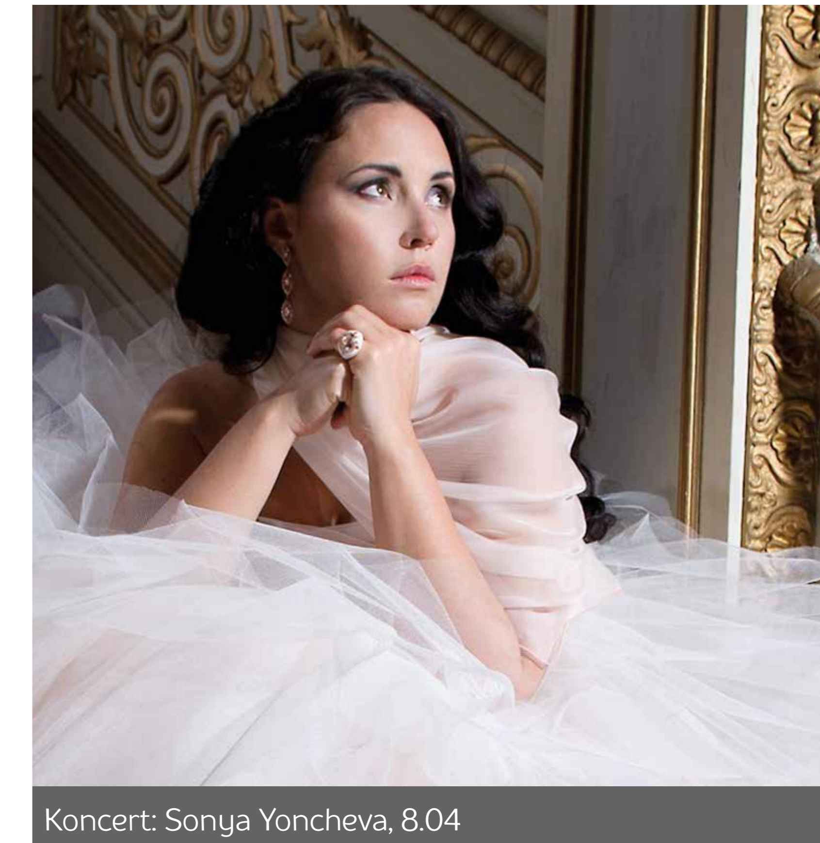
Koncert: Sonya Yoncheva, 8.04

Pełne kalendarium w wersji papierowej dostępne jako darmowy dodatek do IKS-a oraz w wybranych instytucjach kultury. Afisz w wersji elektronicznej do pobrania na wmpoznan.pl . Więcej informacji znajdziecie Państwo na stronie kultura.poznan.pl oraz w miesięczniku IKS . Redakcja nie bierze odpowiedzialności za zmiany wprowadzone po oddaniu materiału do druku. Informacje o wydarzeniach prosimy przysyłać na adres: tomasz.bombrych@wm.poznan.pl do 15. dnia miesiąca.