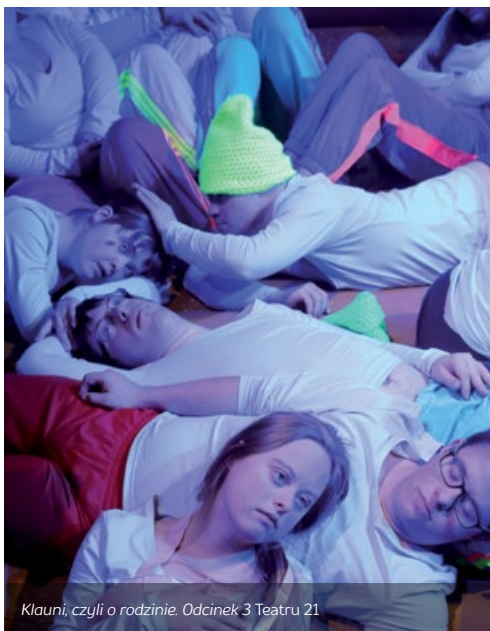
Klauni, czyli o rodzinie. Odcinek 3 Teatru 21

Wykład Polskie odznaki wojskowe. Barwy i symbolika wygłosi Jarosław Łuczak, na wystawie Arcydziela sztuki grawerskiej... Wielkopolskie Muzeum Wojskowe g. 12